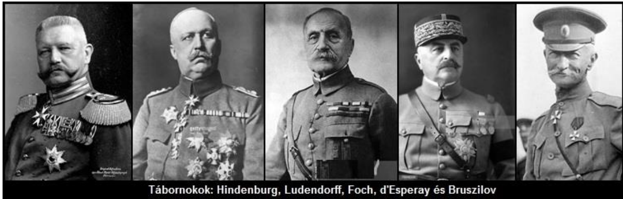
Tábornokok: Hindenburg, Ludendorff, Foch, d'Esperay és Bruszilov

osztrák-magyar haderő vezérkari főnökei voltak (előbbi 1917-ig, utóbbi a háború utolsó évében).